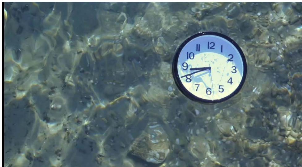
Elizaveta Neronova, capture d'écran

Les bâtiments sont ouverts du lundi au vendredi de 07h30 à 18h30.