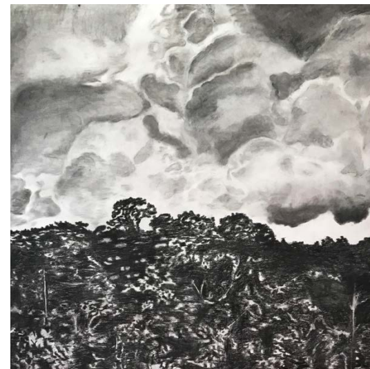
Classe 2Cad, fusain