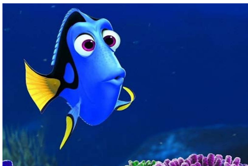
Le Monde de Nemo, Pixar Animation Studios et Walt Disney Pictures, 2003.

Dans cet atelier nous réfléchirons brièvement au fonctionnement de votre cerveau pour pouvoir l'utiliser efficacement, puis nous testerons différentes méthodes d'apprentissage afin de trouver celles qui vous conviennent.