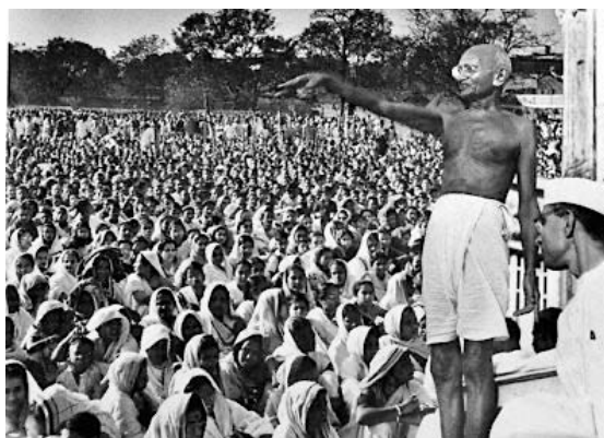
Discours de Gandhi « Quit India », 8 août 1942 à Bombay.

Alors, prêt·e à prendre la parole pour défendre vos idées ?